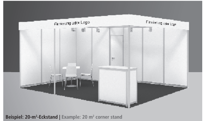
Beispiel: 20-m 2 -Eckstand | Example: 20 m 2 corner stand

Die Preise enthalten die Standflächenmiete, den Messemietstand mit angegebener Leistungsbeschreibung zzgl. 280,00 EUR Medien- und Besucher-Marketingpauschale (Leistungen siehe Seite 6b/12. Spezielle Teilnahmebedingungen), AUMA-Beitrag 0,60 EUR/m 2 . Alle Preise zzgl. USt. | Prices included stand area rent, rental stand construction as described compulsory media and visitors marketing flat-rate of 280.00 EUR (services see page 6b/12. of the Special Conditions of Participation), 0.60 EUR/m 2 AUMA fee. All prices plus VAT.